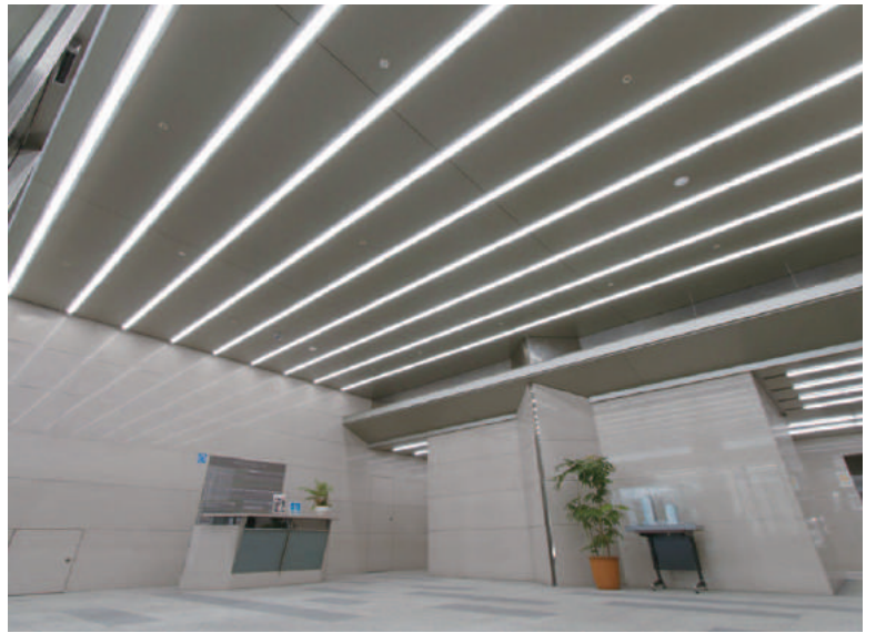
有明フロンティアビル 様(東京都)